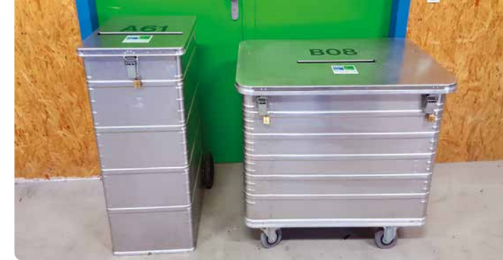
240 I ca. 30 Ordner