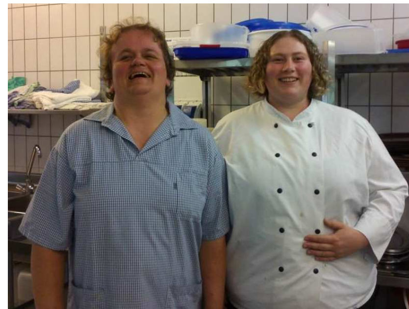
in einem Seniorenheim in Bad Wörishofen