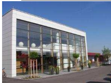
G- Werkstatt 233 Förderstätte 32