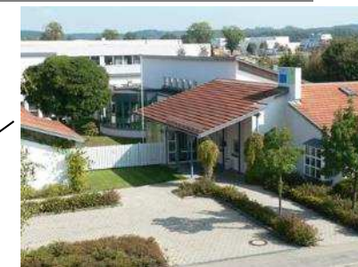
G- Werkstatt Hauptwerkstatt 75

Unterallgäuer Werkstätten Memmingen - Mindelheim