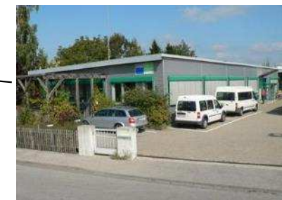
G- Werkstatt Außenstelle 70