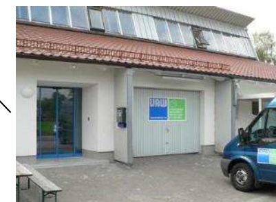
P- Werkstatt 59