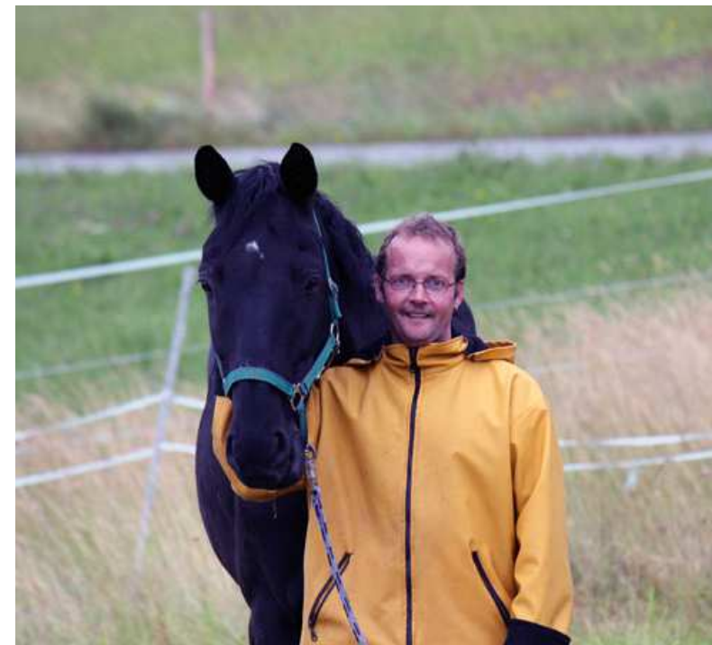
auf dem Pferdehof in Holzgünz