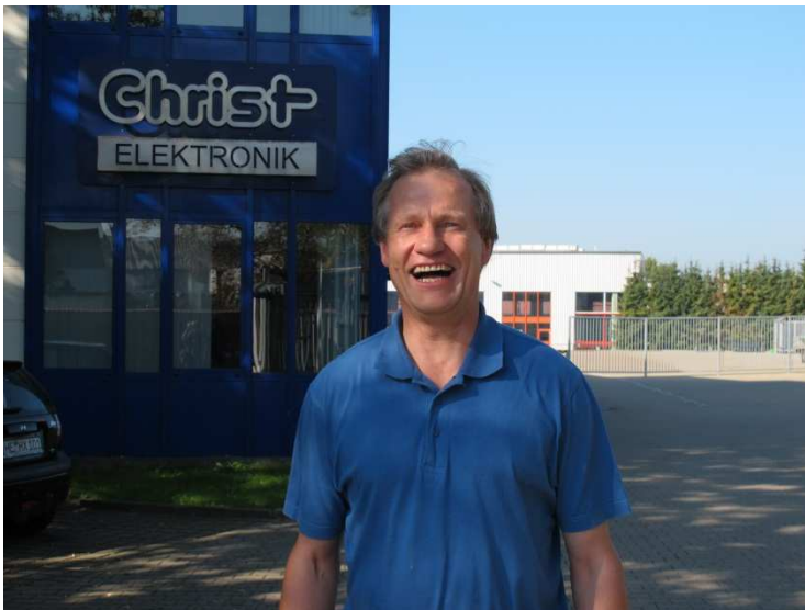
bei der Firma Christ in Memmingen