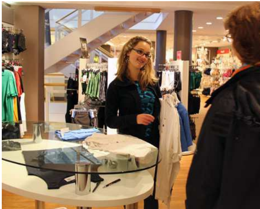
bei der Firma Stammel in Mindelheim