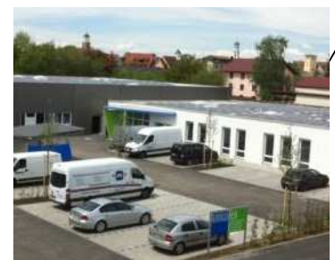
P- Werkstatt 68